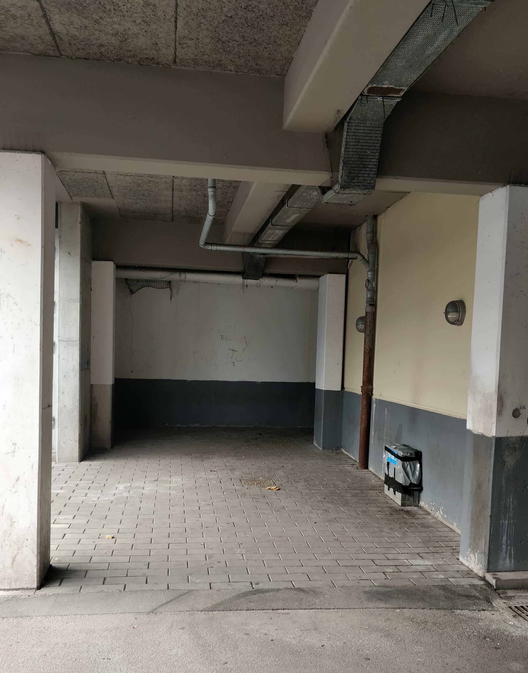
Dette er blandt andet et af hjørnerne jeg har set slagsmål, det sker ikke kun på sådan nogle hjørner men det sker også I forskellige kældre, hvor der ikke er video overvågning.